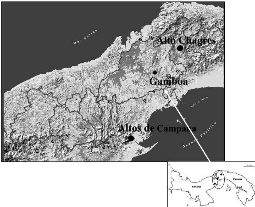
Figura 1. Ubicación de los sitios de estudios Altos de Campana, Gamboa, Alto Chagres, Panamá, Rép. Panamá.

Caracterización de las áreas de estudio: Para realizar las colectas de los especímenes se escogieron tres áreas boscosas dentro de la cuenca hidrográfica del Canal de Panamá y cercanas a zonas rurales, allí se ubicaron los puntos de muestreos (Fig.1).